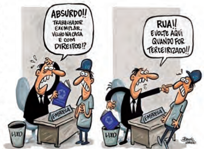
Charge do Paulo Galvão, reprodução do Arquivo Google